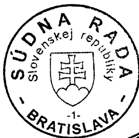
JUDr. Štefan Harabin p r e d s e d a

V návrhu rozpočtu na roky 2012-2014 nie sú plánované ani rozpočtové prostriedky na získanie priestorov pre vlastné sídlo Najvyššieho súdu Slovenskej republiky a vlastných priestorov pre Súdnu radu Slovenskej republiky a jej kanceláriu, ktoré sú v súčasnosti umiestnené v priestoroch na základe Zmluvy o výpožičke uzavretej s Ministerstvom spravodlivosti Slovenskej republiky a sú napriek priestorom získaným na nám. SNP nedostačujúce.“